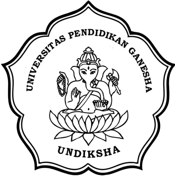
(Diameter logo 8 cm)